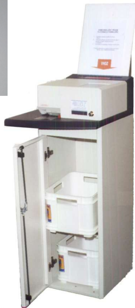
Odkládací prostor s přepravkami