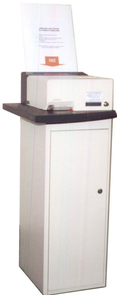
Celkový pohled (model 756)

Zařízení umožňují další zvýšení komfortu obsluhy klientů a racionalizace práce. V aktuálních podmínkách je největší výhodou vyloučení přímého styku klientů se zaměstnanci.